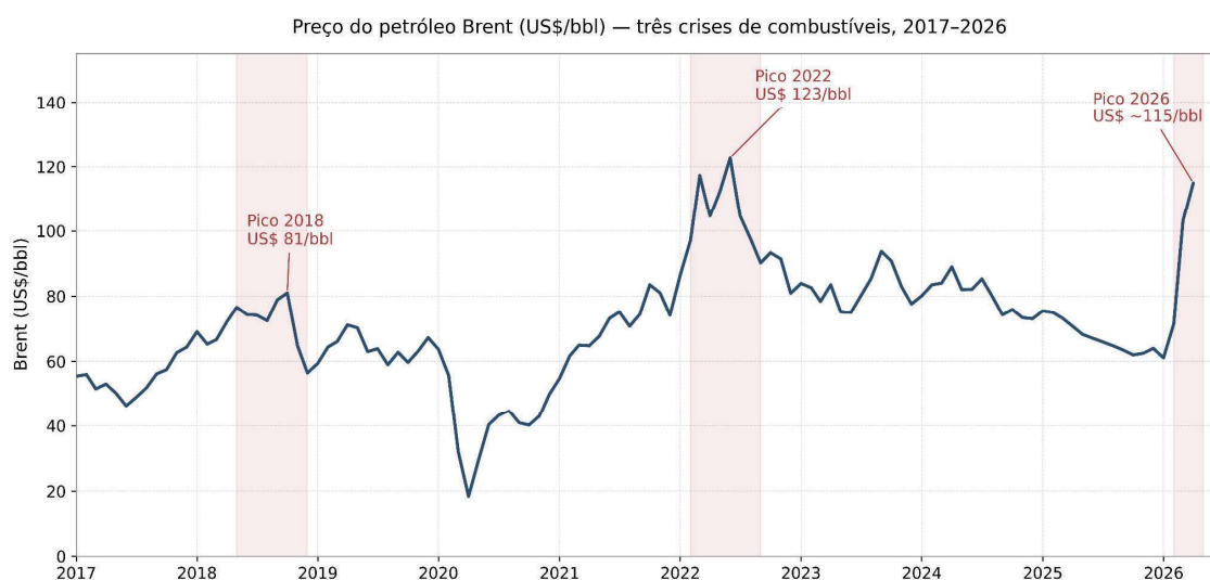
Gráfico 1 — Preço do petróleo Brent (US$/bbl), janeiro de 2017 a abril de 2026. As áreas sombreadas marcam os três períodos de crise.

Valores mensais médios.